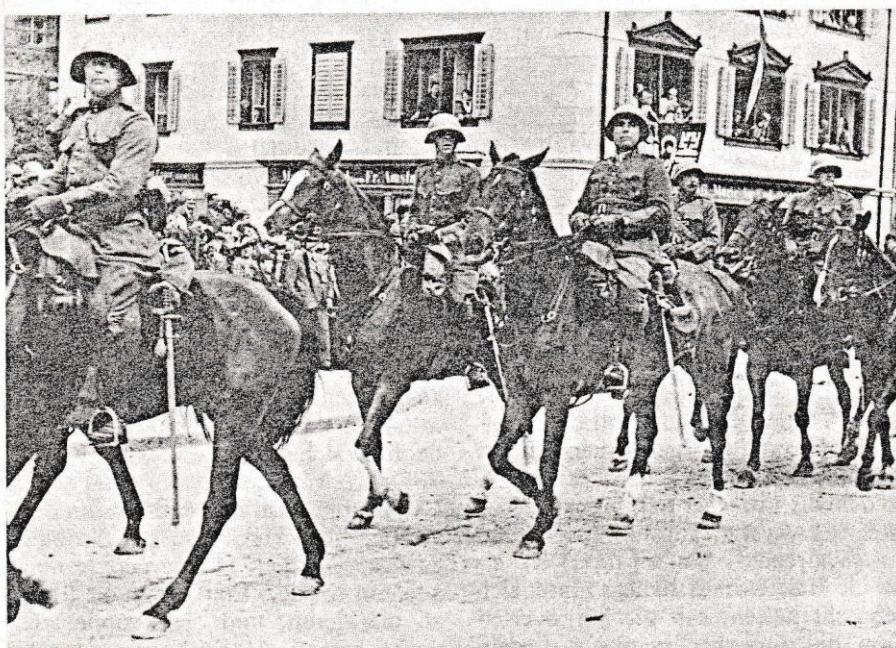
Stab Geb Inf Rgt 20 defiliert am 12. August 1937 vor dem Winkelrieddenkmal.

In diesen Ansprachen kam so recht zum Ausdruck, wie gespannt das Verhältnis zwischen Luzernern und