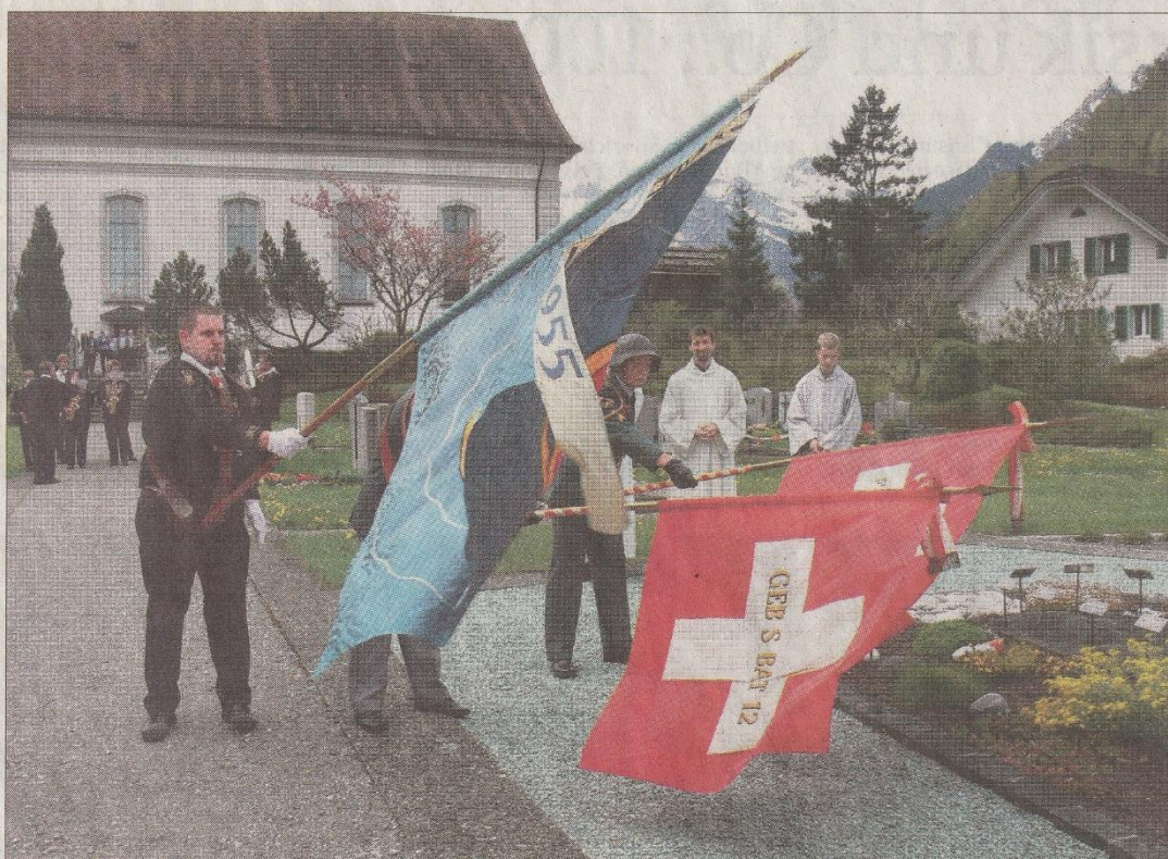
Auf dem Friedhof Wolfenschiessen gedenkt die Militärvereinigung der verstorbenen Kameraden.